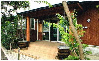
玄関の外壁にも木が使われている。

まれているように思います。私はよくどんな保育園がいいですか、と聞かれるのですが、人が人を育てる場所ですから、人を見て下さいとお答えしています。この保育園は子どもたちにとつてのびのびできる場所であり、職員にとつても、間違いなく働きやすい職場であると思います」。