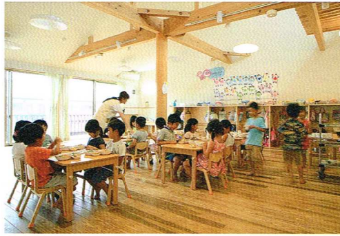
3,4,5歳児の保育室の床は無垢材を使用。素足が靴下のみの子どもが多い。