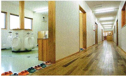
小さな便器が並ぶ3、4、5歳児のトイレ。