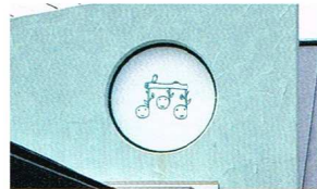
音符をデザインした園のマークのある防火壁。