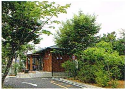
園舎前に植えた植栽が大きく育ち、森のよう。