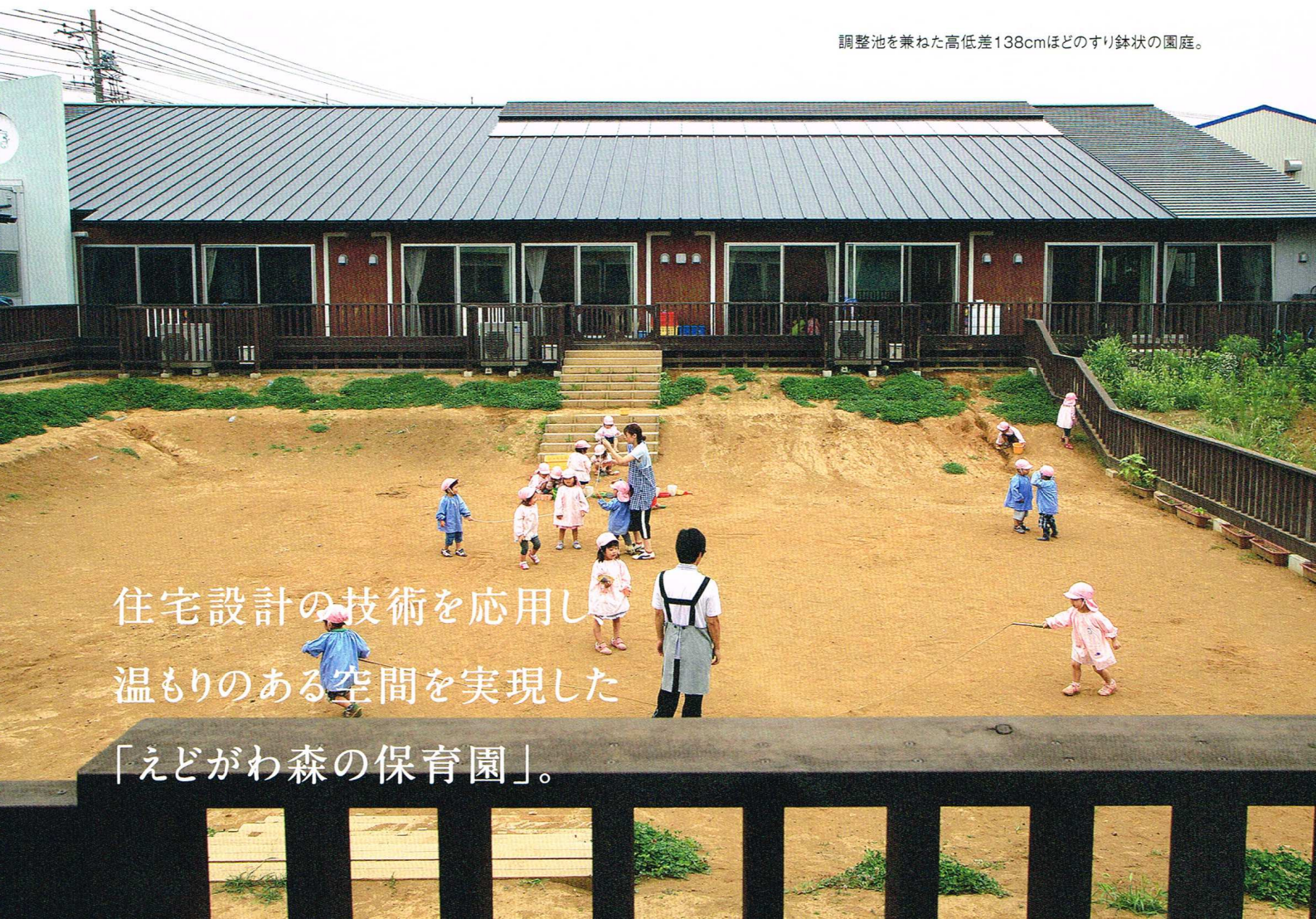
調整池を兼ねた高低差138cmほどのすり鉢状の園庭。

それより驚いたのは、保護者の皆さん の反応だったといいます。「自然の木を 使っていますので、穴とかひび割れとか当 然あるわけですが、子どもが指を突っ込ん で危ないのではという指摘が入園後2カ 月ぐらい続きました。けれども3ヶ月ぐ らい過ぎた頃にはそれもびつたりと無く なり、『木ついでいですね』というふうに変 わっていききました」と当時を振り返りなが