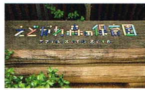
愛らしいロゴで書かれた保育園の看板。