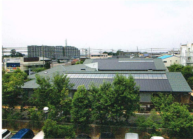
OMの集熱ガラスを搭載した園舎を南側の大学建物から写す。計画的に果樹や花が植樹され、四季を楽しむ雑木の森に囲まれた園舎。