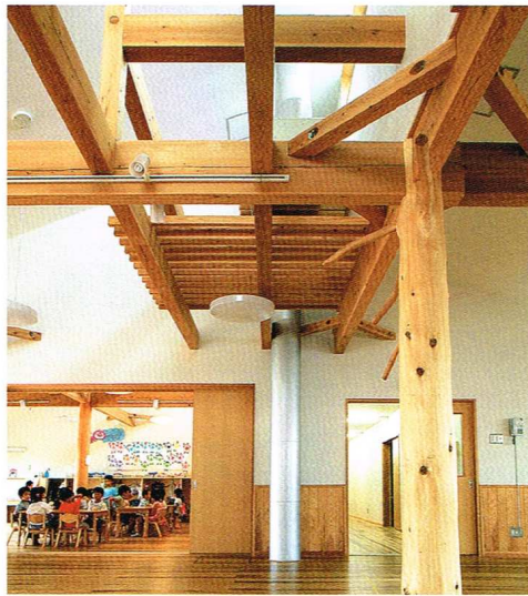
天井を覆わず開放的な空間。ハンドリングボックスが見える。