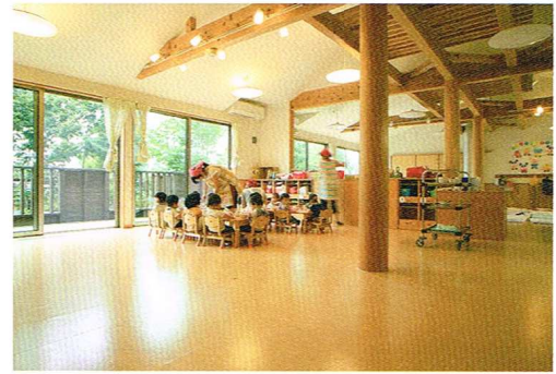
拭き掃除がしやすいよう床にリノリウムを使用した低年齢児の保育室。