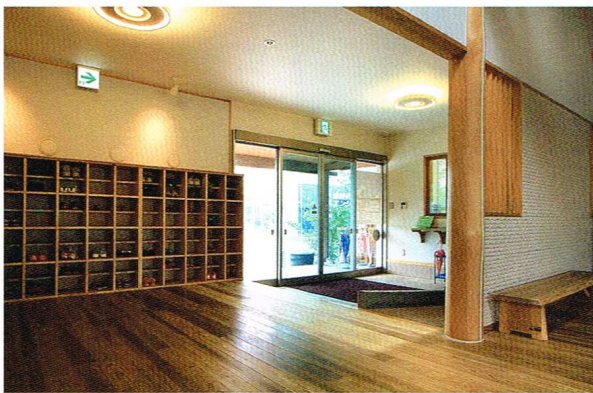
木の香りと太陽の温もりが迎える玄関。